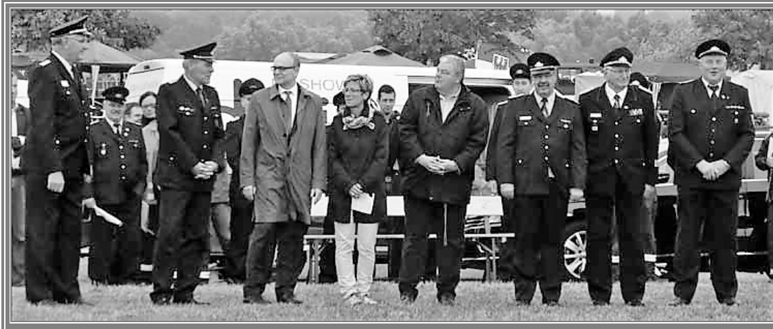
Eröffnungsveranstaltung am 13.09.2014 Ehrgäste um Ministerpräsident von MV Erwin Sellering (vorn 3. von links)