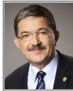
Lorenz Caffier MV-Innenminister seit 2006