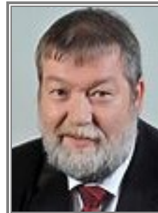
Ralf Mucha (SPD) Landtagsabgeordneter MV