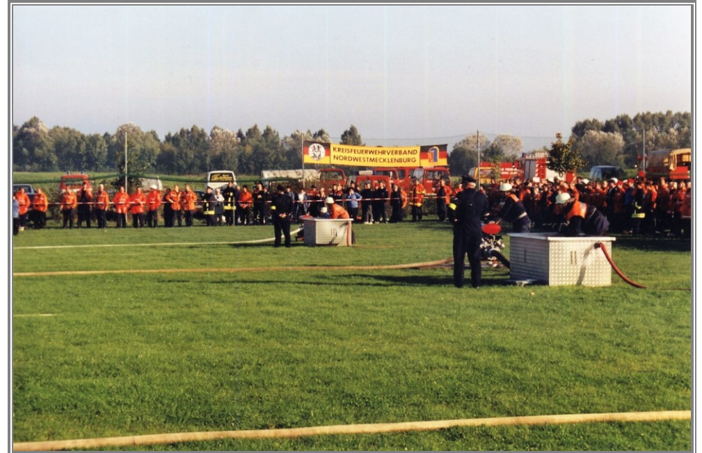
Der Golfplatz gestattet einen Wettkampf auf mehreren Bahnen