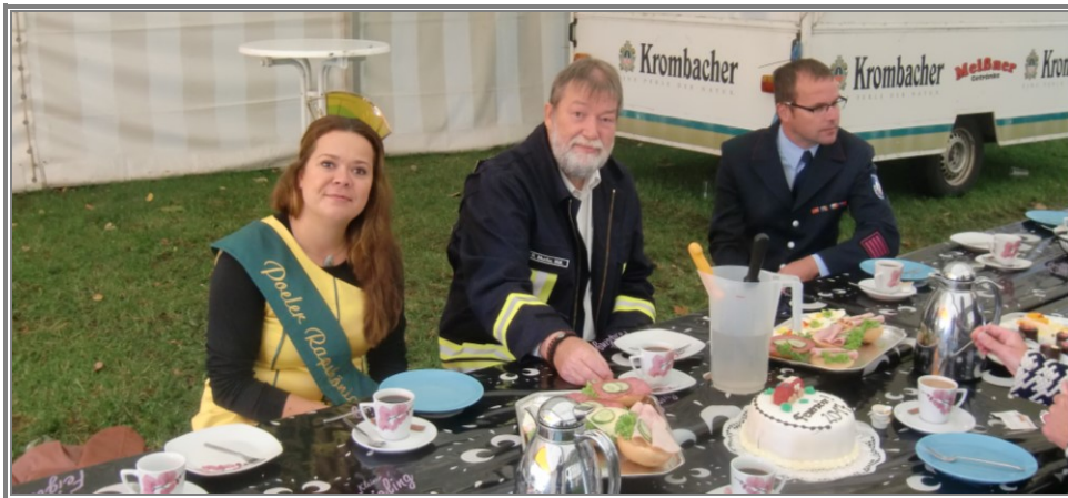
Einladung der Ausrichter und der Bürgermeisterin der Gemeinde Ostseebad Insel Poel zum gemeinsamen Frühstück im Festzelt mit den Ehrengästen – eine schöne Tradition. Links: Die Rapskönigin der Insel Poel. Mitte: SPD-Landtagsabgeordneter Ralf Mucha.