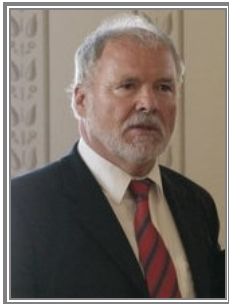
Dr. Harald Ringstorff MP von MV bis 2008