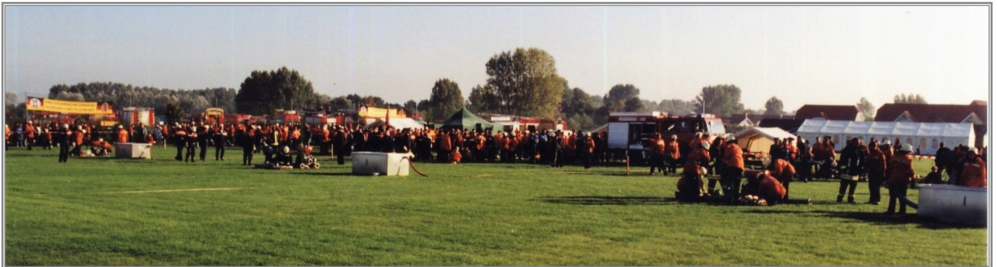
Blick auf die weitläufige Wettkampfanlage in Gollwitz (Poel)