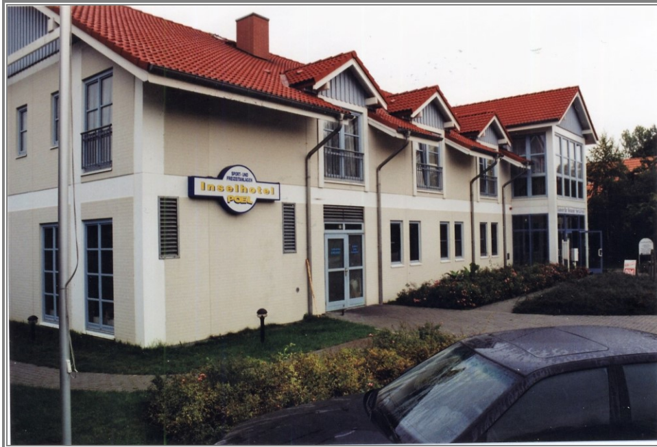
Gute Unterbringung auch im „Inselhotel Poel“ Gollwitz nahe dem Wettkampfplatz