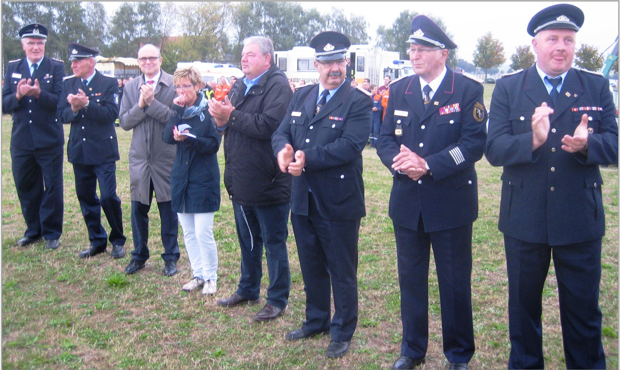
Eröffnung des bundesweit größten Wettkampfes im „Löschangriff-nass“.